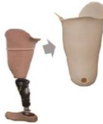
義足および義足カバー