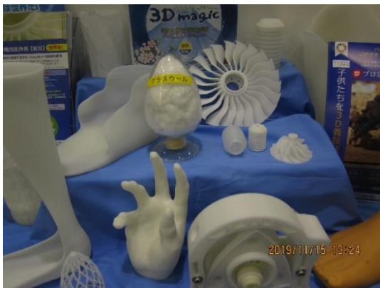
3D プリンター用フィラメントによる試作品

PP は自動車や家電などの多くの製品で使用されている汎用樹脂であるが、収縮が大きいことから 3D プリンター用途での使用はできなかった。ガラスウールを配合し、収縮をコントロールすることで層間密着度が改善し、PP 樹脂での 3D 造形が可能となった。着色することができる意匠性の優れた義足や義足カバーとして用途を拡大している。