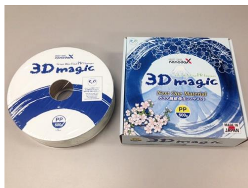
3Dプリンター用フィラメント「3D magic」

一方、PPは車などに大量に使われているが、PPの収縮特性が大きいため3Dプリンターのフィラメントとしては使用できなかった。そこで、アスペクトの小さいグラスウールを適量配合することで結晶性樹脂の配向性を緩和し、収縮をコントロールする独自技術確立。造形性に優れたPPのフィラ